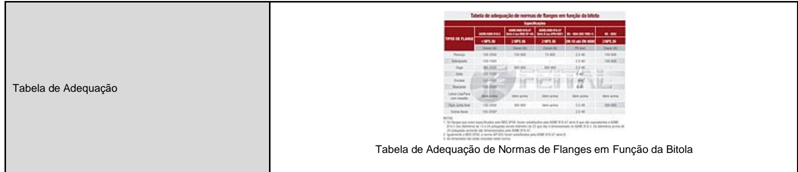
TABELA DE ADEQUAÇÃO DE NORMAS DE FLANGES EM FUNÇÃO DA BITOLA

Os tipos de face tipicamente são: Face lisa, Face ressalto, Face para junta anel e macho e fêmea. O acabamento da face pode ser medido pela AARH e normalmente chamados de liso, ranhurado concêntrico e ranhurado espiral.